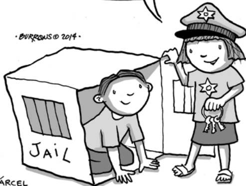
Peter thus was being kept in prison, but prayer by the Church was fervently being made to God on his behalf. Acts 12:5